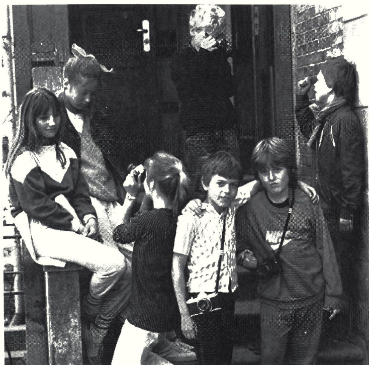
Et hårdt liv for et kamera. Men fotoholdet på Bernadotteskolen i Hellerup har stor glæde af Pentax'erne.