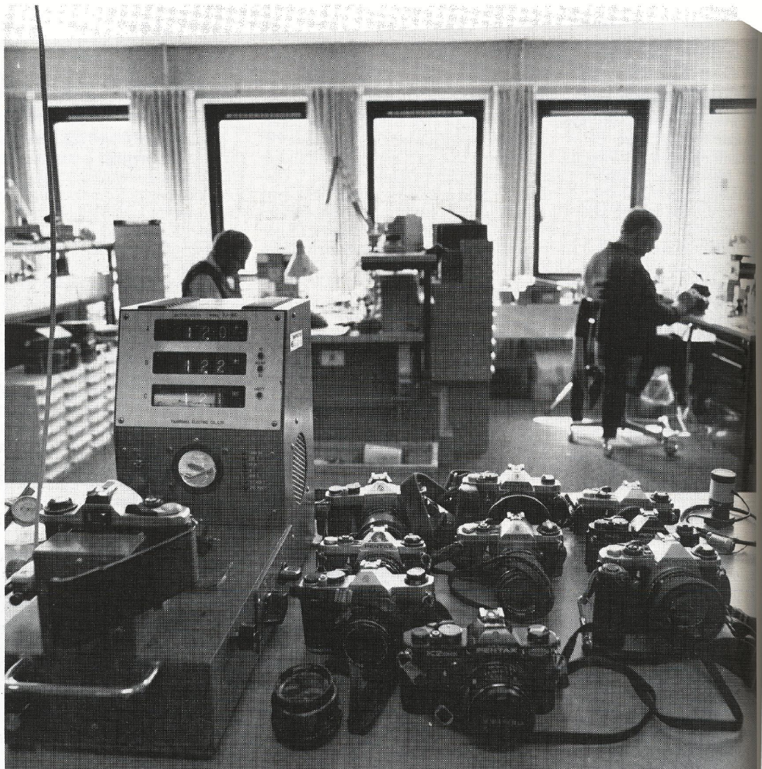
Fotografer stiller ofte urimeligt store krav til deres udstyr. Testmålingerne hos »Fototeknik« viste, at Pentax kameraerne kan klare års hårdt slid uden at det går ud over billedkvaliteten.

Et par af læserne undrer sig over, at Pentax MX og ME ikke kan bruge samme winder. Men trods ligheden i det ydre, er der tale om to vidt forskellige konstruktioner - MX'eren kan således også tilsluttes en hurtig motor og 250 billeders bagstykke. I øvrigt oplyser Pentax-importøren (Polack), at under 2% af M-kameraerne dukker op på 64-VII-VIII