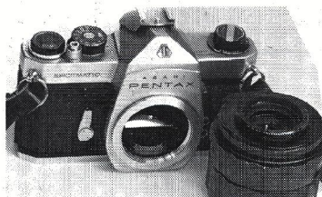
Spotmatic-modellen med standardgevind. Hvad er der blevet af alle de glimrende kameraer, der er solgt i årenes løb?

- Der har aldrig været problemer med disse kameraer. Så jeg solgte udelukkende de to ME-huse for at få råd til LX-huset. Men så begyndte problemerne til gengæld. - Sommeren forløb fint, men til efteråret skulle det